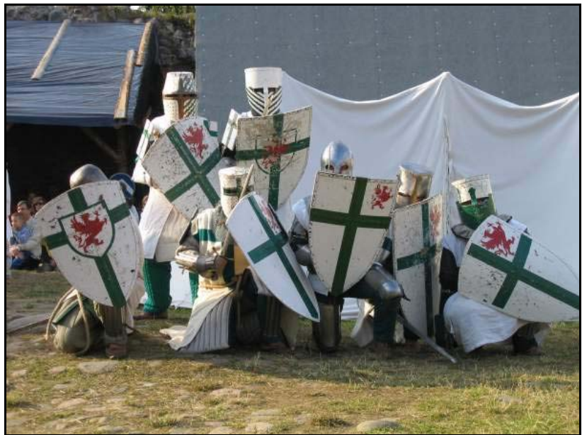
Sommer der Geschichte in Alt Draheim