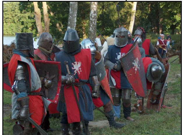
Kampf um Draheim/Drahim war immer: Weiss gegen Rot – oder umgekehrt!