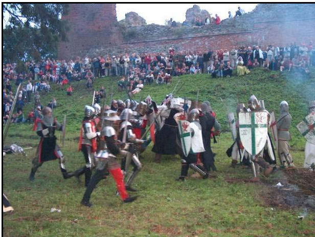
Historisches Spektakel mit modernen Tempelrittern