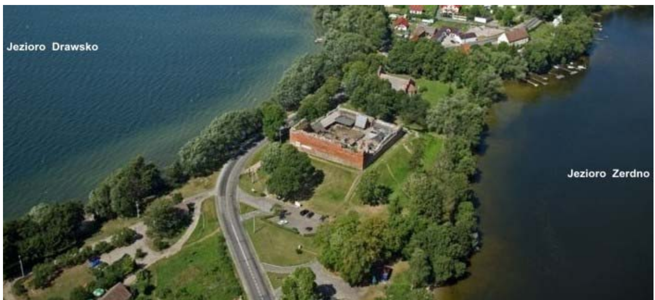
Auf der Landzunge zwischen (links) Dratzig-See und (rechts) Sarebensee: Burg Draheim, seit 2005 private Touristenattraktion

Inzwischen ist die Burgruine privatisiert worden und mit neu erstellten Gebäuden im Inneren der Umfassungsmauer für touristische Veranstaltungen hergerichtet. Unter dem Kreuz des Templerordens, der Tempelburg einst gründete und das Land Draheim kolonisiert hatte, finden im Sommer historisch nachgestellte Ritterspiele und sonstige Spektakel statt. Leider ist die interessante Website www.drahim.pl nur in polnischer Sprache abgefasst. Sie enthält aber zahlreiche Fotos von den Veranstaltungen. Der Tourismus hat den Ort erfasst. Im Dorf Stare